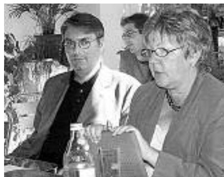
Im „Café Leo“ der AWO Karlsruhe: Johannes Jung und Staatssekretärin Marion Caspers-Merk.

Bedeutung dieser Arbeitsmaßnahmen als Voraussetzung für eine nachhaltige Drogenhilfe besonders hingewiesen. Die Staatssekretärin, die zusammen mit dem Vorstandsmitglied der AWO Karlsruhe, MdB Johannes Jung, das „Café Leo“ besuchte, äußerte sich anerkennend zum Verlauf des Projekts. Die Stadt, die AWO und der Bund hätten in vorbildlicher Weise den erfolgreichen Versuch unterstützt und getragen.