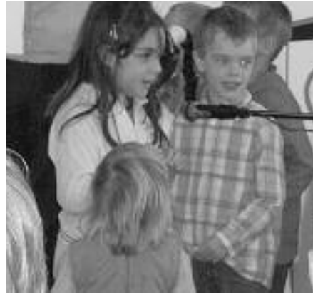
Die sprachbehinderten Kinder hatten extra geübt – die Sätze am Mikrofon klappten prima.